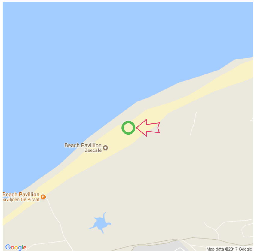
Strand Oostkapelle (15-12-2017)