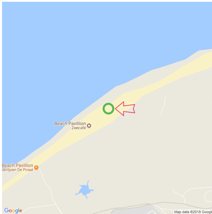
Strand Oostkapelle (24-02-2018)

1 Aan de gegevens die hier staan kunnen geen rechten ontleend worden. De informatie op deze pagina zijn voor een groot deel afkomstig van bezoekers. Zie je fouten of heb je aanvullingen, help anderen en geef het door op naturismegids.nl