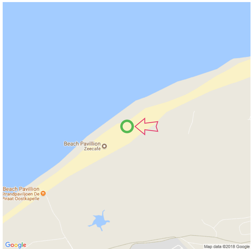
Strand Oostkapelle (21-05-2018)