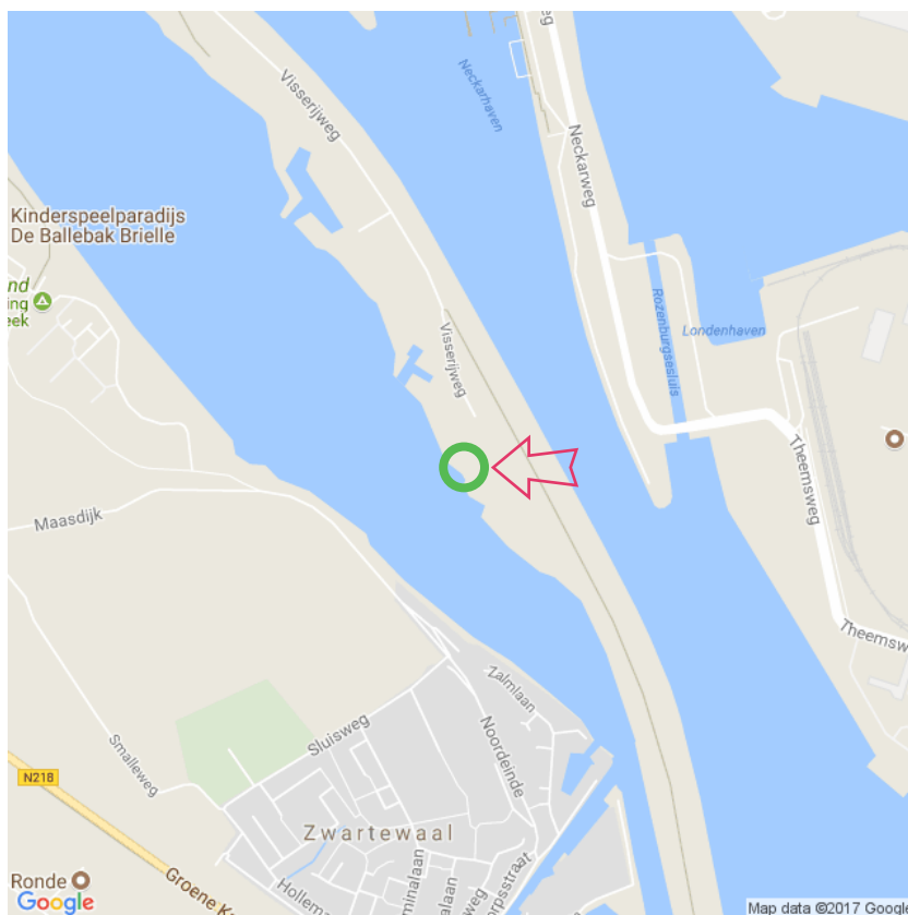
Brielse Meer (22-09-2017)