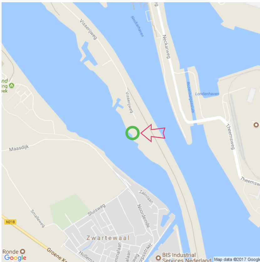
Brielse Meer (15-12-2017)