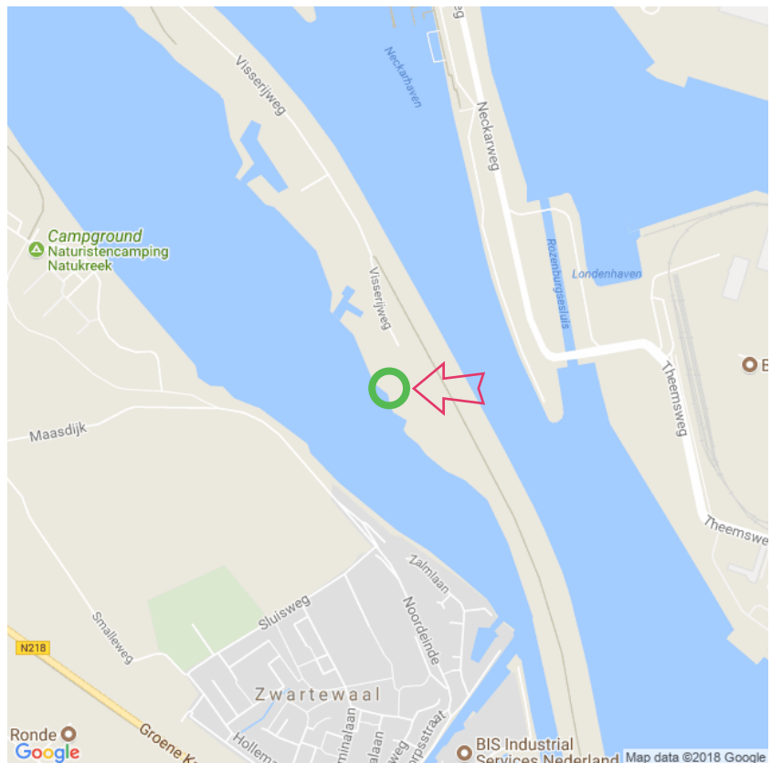
Brielse Meer (20-06-2018)