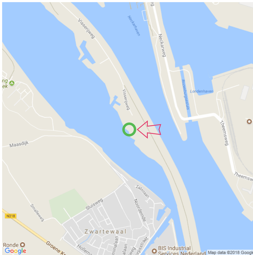
Brielse Meer (22-03-2018)