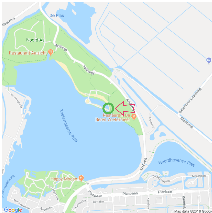
Zoetermeerse Plas / Noord AA (19-08-2018)