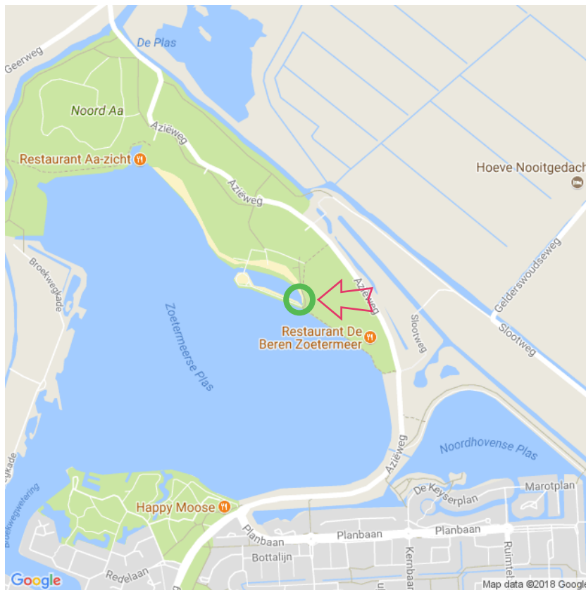
Zoetermeerse Plas / Noord AA (18-01-2018)