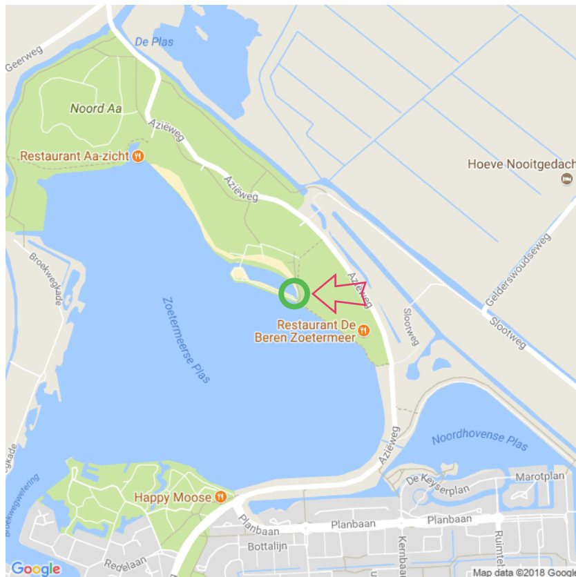
Zoetermeerse Plas / Noord AA (24-03-2018)