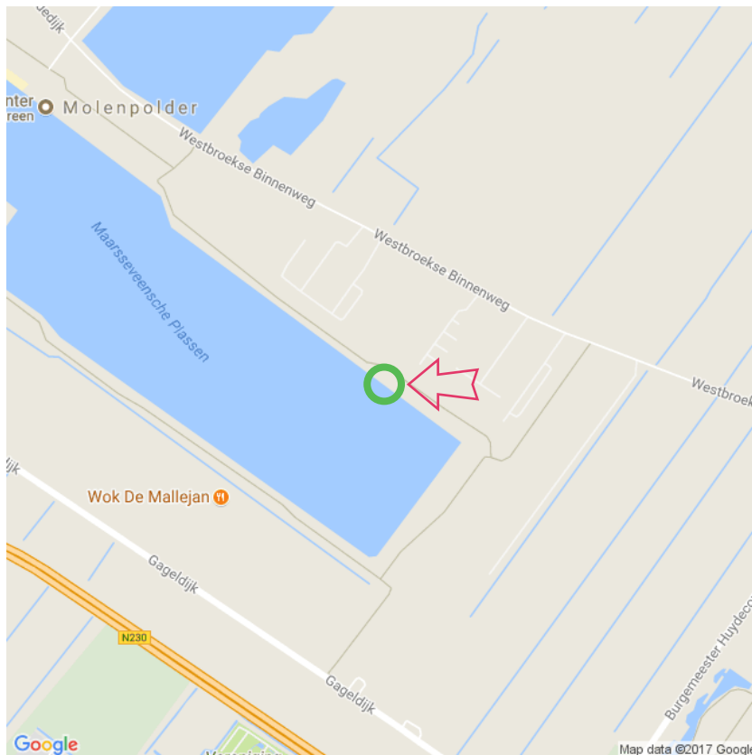
Maarsseveense Plassen (gratis strand) (13-12-2017)