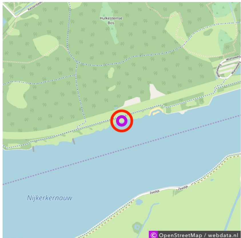
Laakse Strand (15-02-2019)