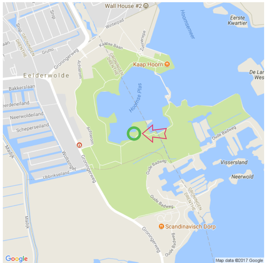
Hoornse Plas (20-09-2017)