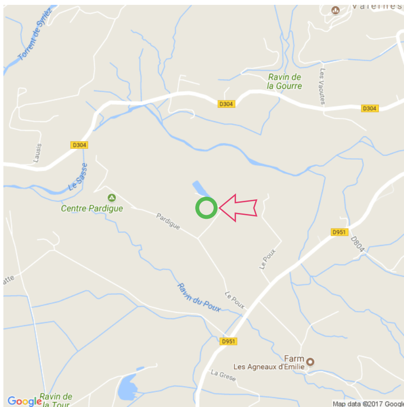
Centre Pardigue (25-09-2017)