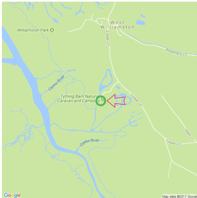
Tything Barn (25-09-2017)