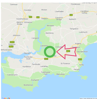
Tything Barn (17-07-2018)