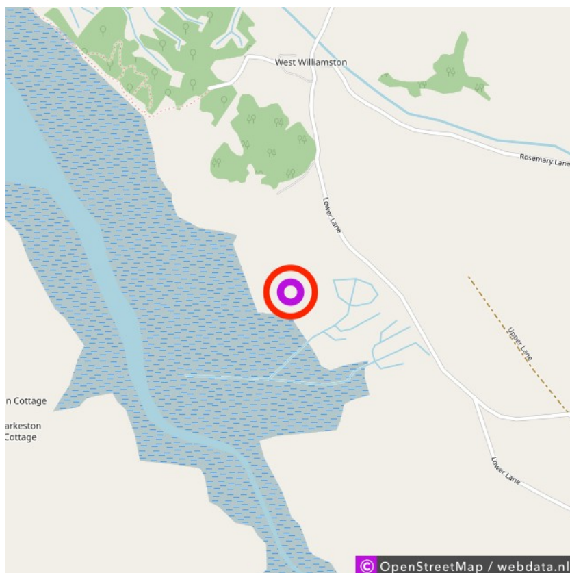
Tything Barn (20-02-2019)