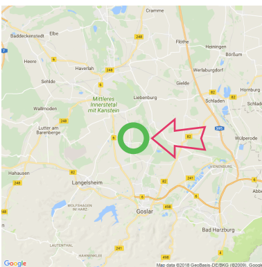
BffL Goslar (24-06-2018)