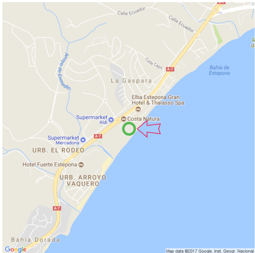
Costa Natura Resort (19-11-2017)