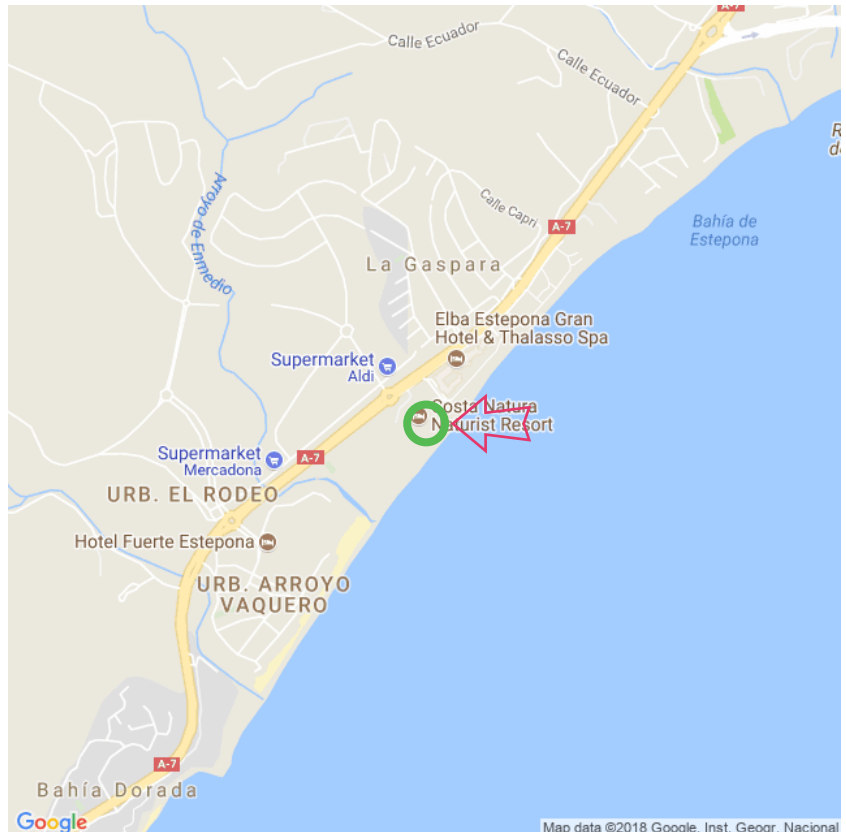
Costa Natura Resort (25-05-2018)

① Aan de gegevens die hier staan kunnen geen rechten ontleend worden. De informatie op deze pagina zijn voor een groot deel afkomstig van bezoekers. Zie je fouten of heb je aanvullingen, help anderen en geef het door op naturismegids.nl