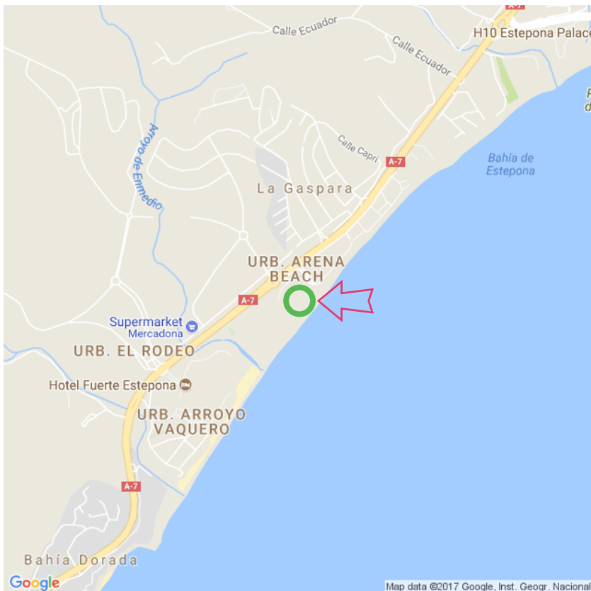
Costa Natura Resort (17-08-2017)