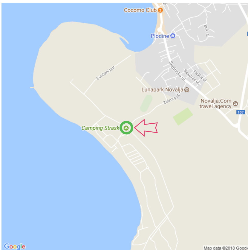
Camping Strasko (25-03-2018)