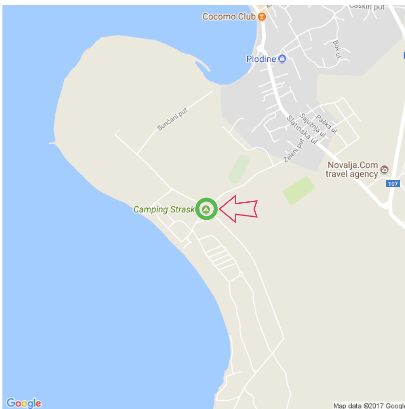
Camping Strasko (12-12-2017)