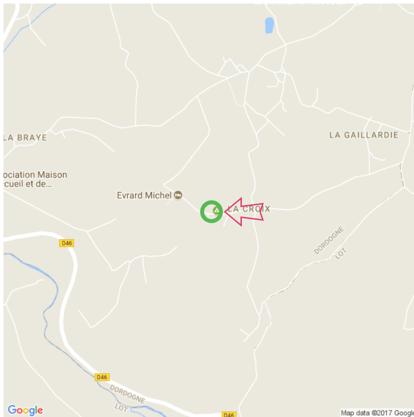
Le Marcassin de Saint Aubin (25-09-2017)