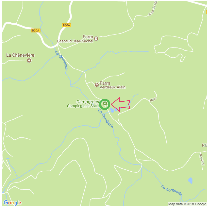
Camping Les Saules (18-06-2018)