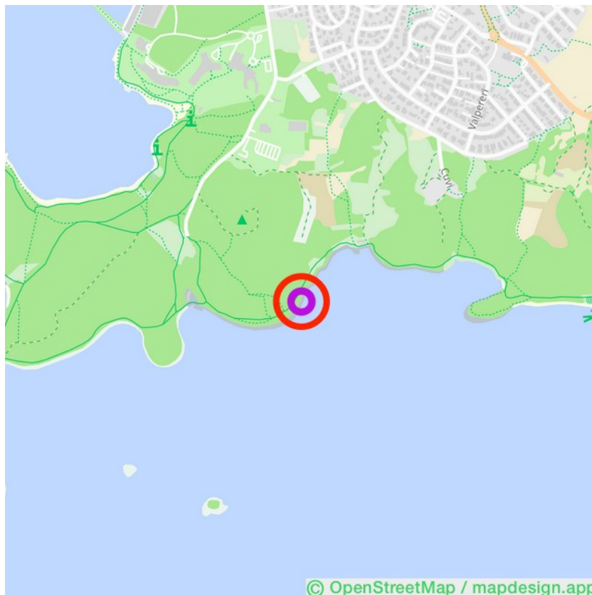
Strandje net buiten Zlatni Rt park (o8-12-2021)