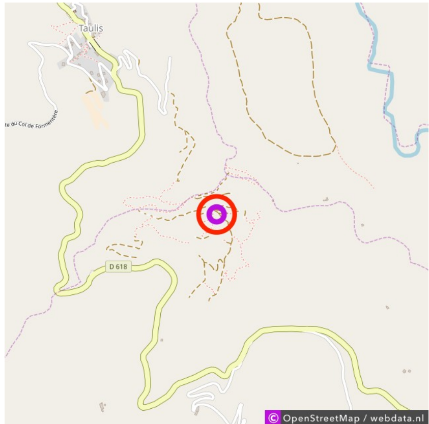
Mas de la Balma (20-11-2018)