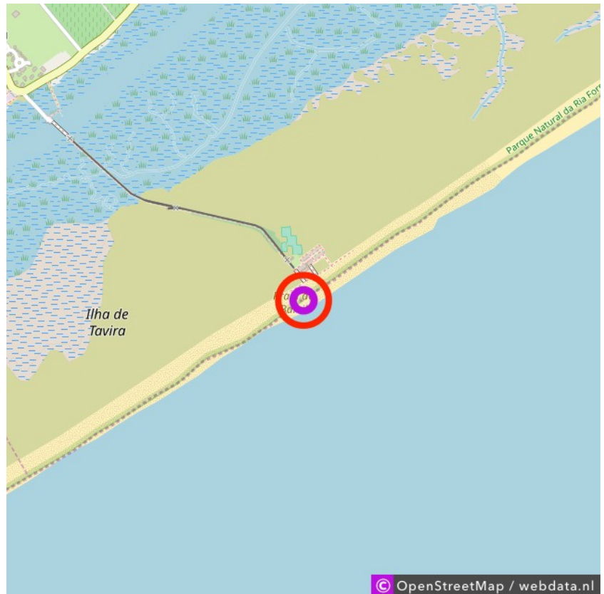
Praia do Barril (23-10-2018)