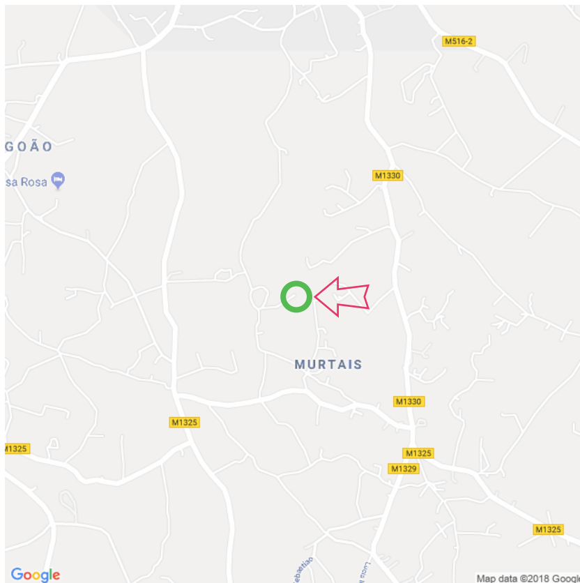
Monte Mimosa (19-08-2018)