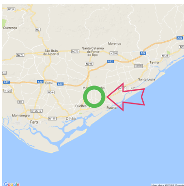
Monte Mimosa (19-01-2018)