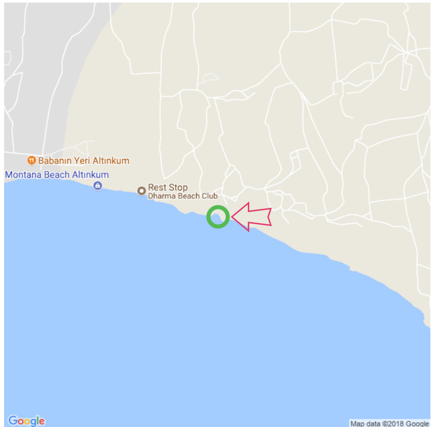
Cesme Altinkum Beach (25-05-2018)