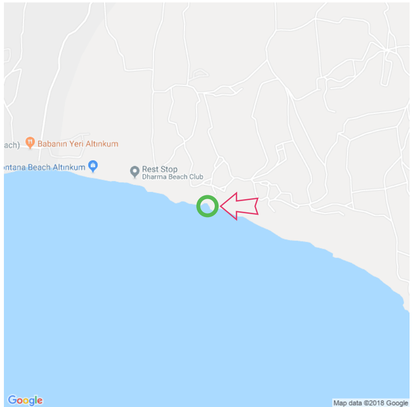
Cesme Altinkum Beach (19-08-2018)