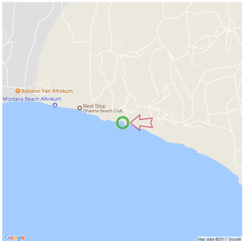
Cesme Altinkum Beach (15-12-2017)