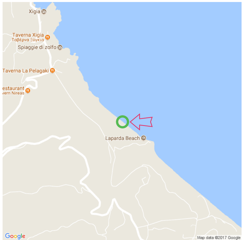
Laparda Beach (17-11-2017)