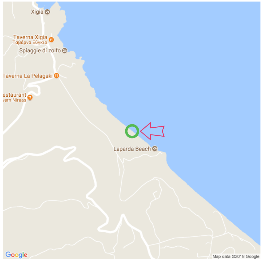
Laparda Beach (18-01-2018)