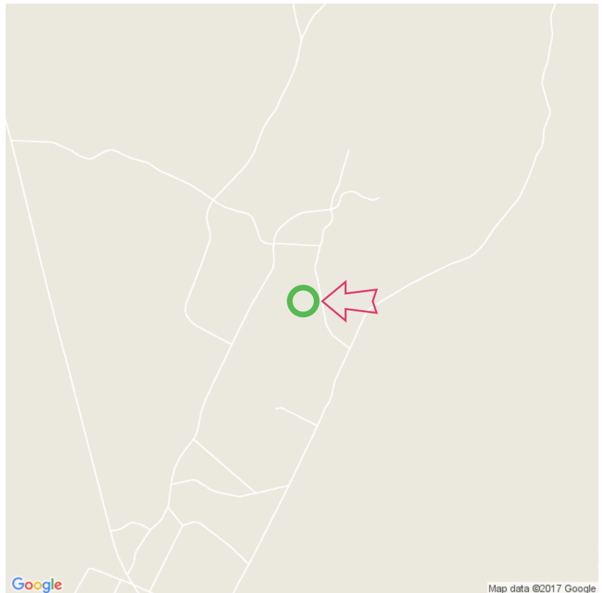
O Nosso Mundo Naturista (17-01-2018)