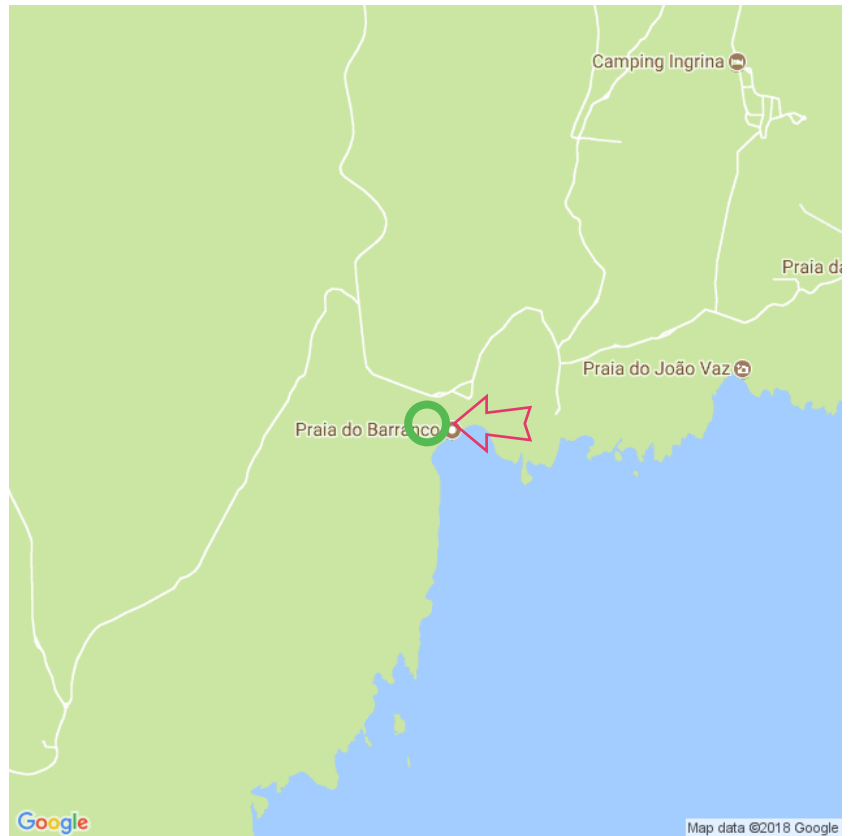
Praia do Barranco (17-01-2018)