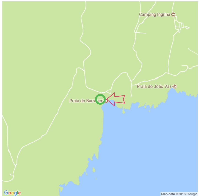
Praia do Barranco (21-03-2018)