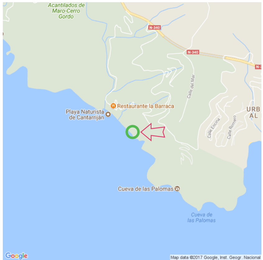
Playa Cantarrijan (17-11-2017)