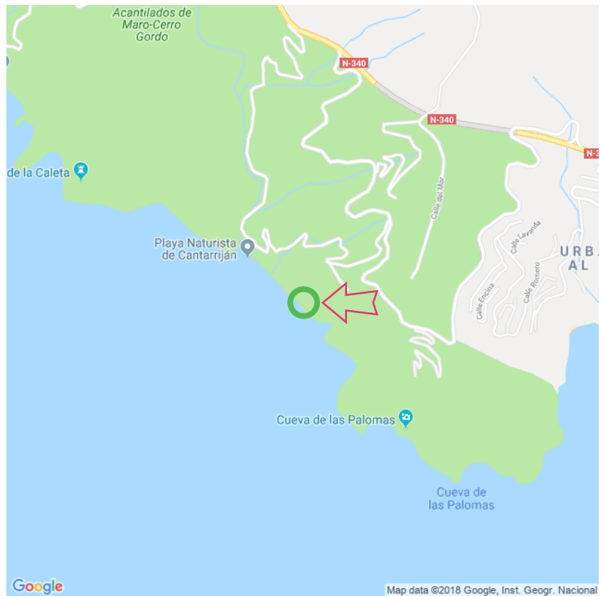
Playa Cantarrijan (16-07-2018)