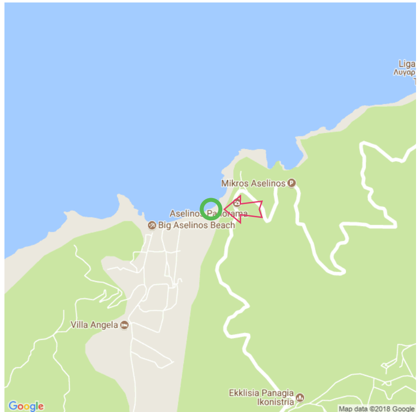
Aselinos Beach (27-04-2018)