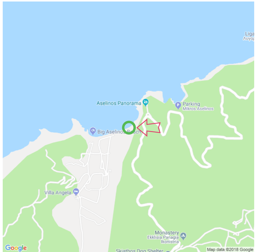
Aselinos Beach (15-08-2018)