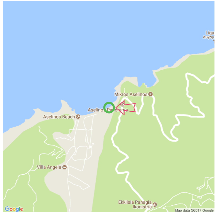
Aselinos Beach (15-12-2017)