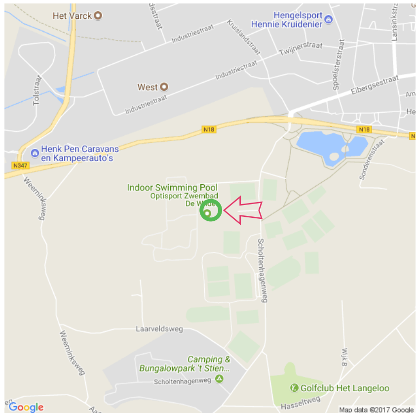
Zwembad De Wilder (20-11-2017)