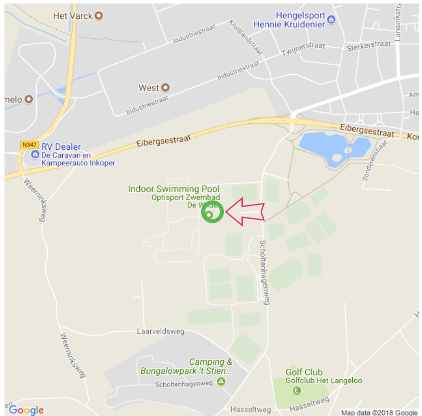
Zwembad De Wilder (20-07-2018)