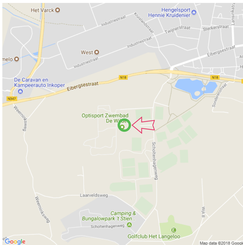
Zwembad De Wilder (18-03-2018)