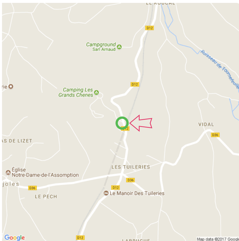
Les Grands Chênes (25-09-2017)