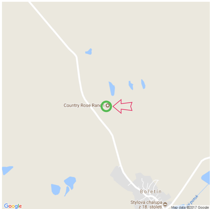
Camping Country-Rose (14-10-2017)