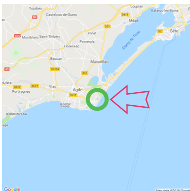
Cap d'Agde (22-08-2018)