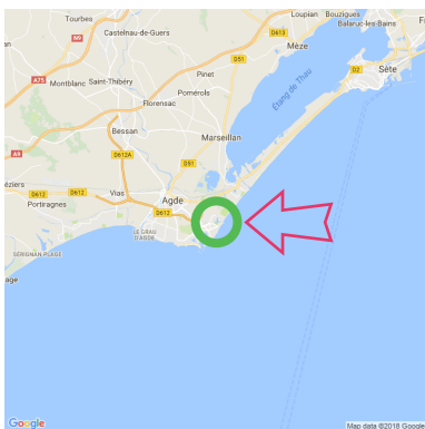
Cap d'Agde (25-03-2018)