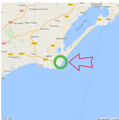
Cap d'Agde (11-12-2017)