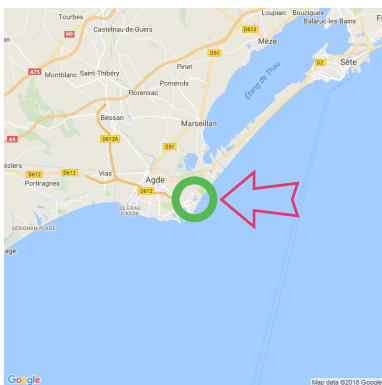
Cap d'Agde (22-02-2018)