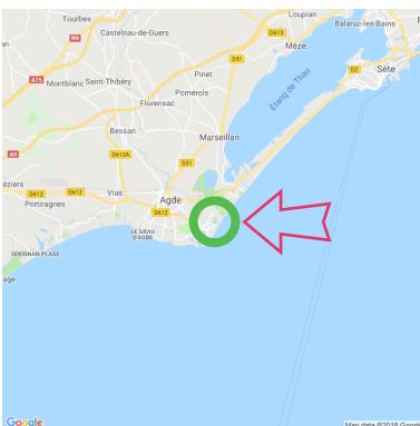
Cap d'Agde (17-08-2018)