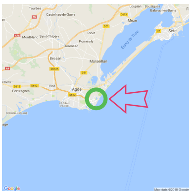
Cap d'Agde (23-04-2018)