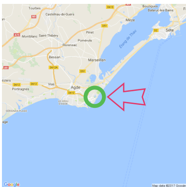
Cap d'Agde (17-12-2017)