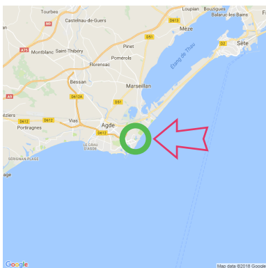
Cap d'Agde (24-06-2018)