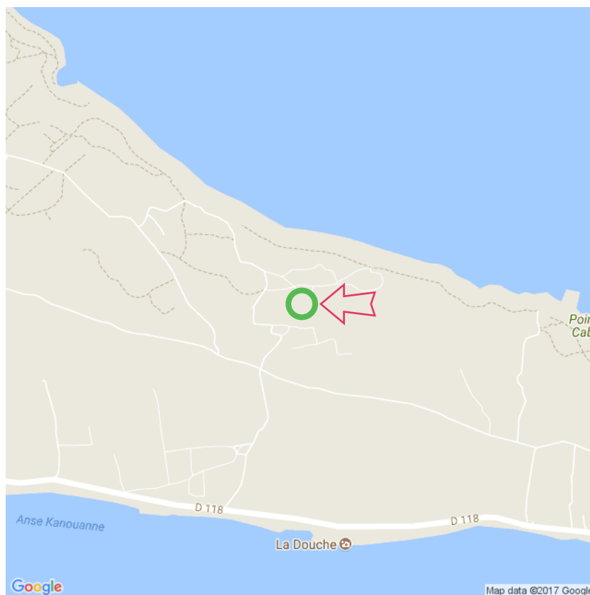
Résidence Naturelle (20-10-2017)