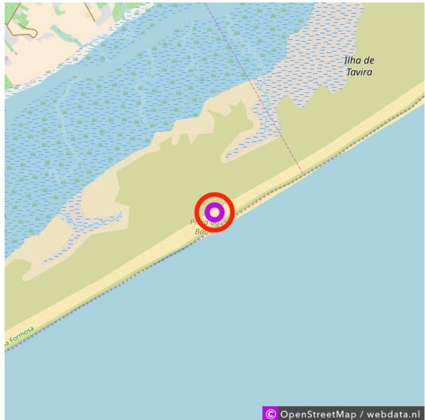
Praia da Ilha de Tavira (21-09-2019)