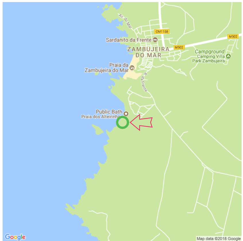
Praia dos Alteirinhos (20-06-2018)