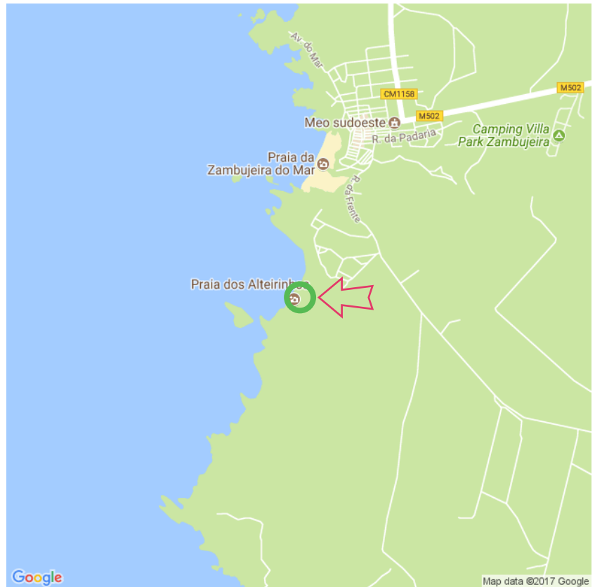
Praia dos Alteirinhos (25-09-2017)