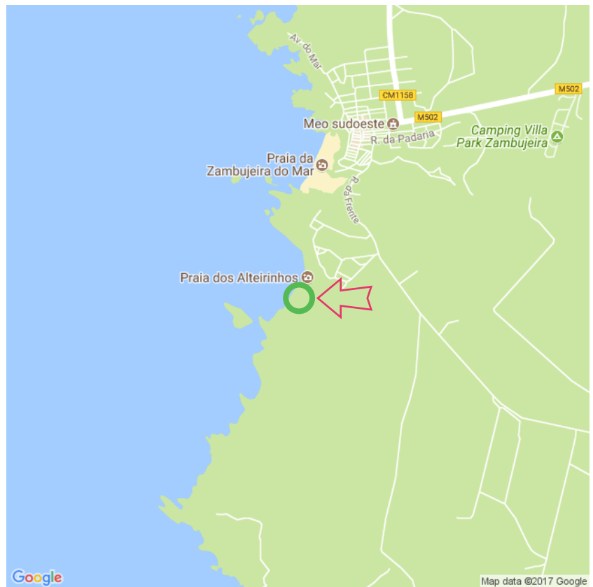
Praia dos Alteirinhos (15-12-2017)