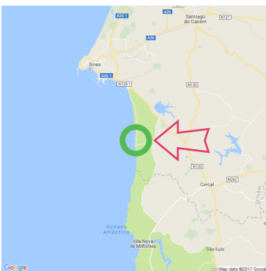
Praia do Salto (14-12-2017)