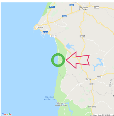
Praia do Salto (17-08-2018)