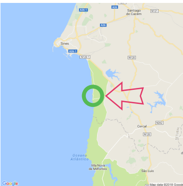
Praia do Salto (19-06-2018)