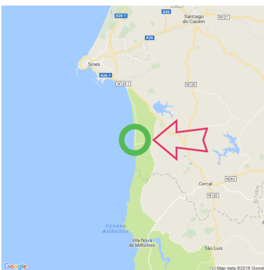
Praia do Salto (22-03-2018)