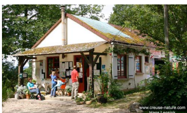
www.creuse-nature.com Hans Lensink