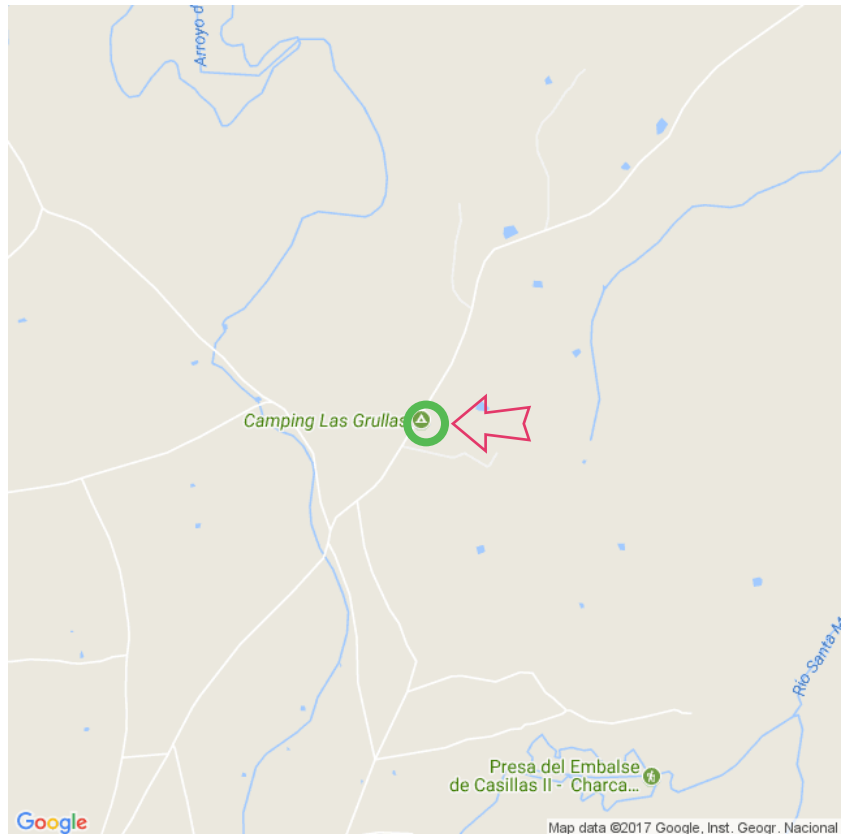
Camping Las Grullas (11-12-2017)