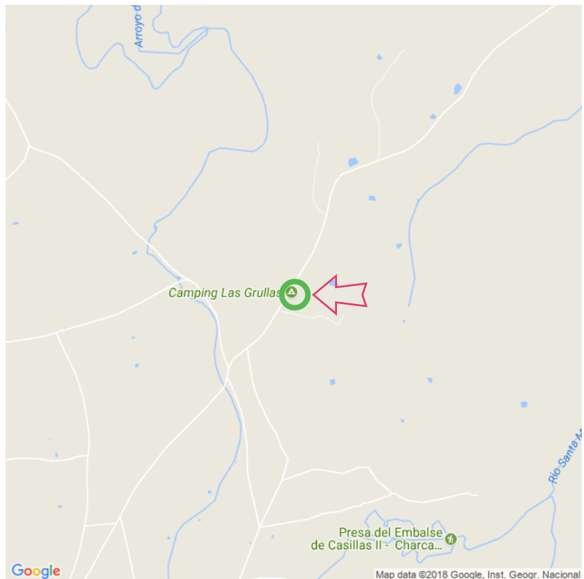
Camping Las Grullas (20-02-2018)