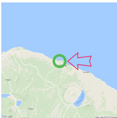
Bali au Naturel (24-03-2018)