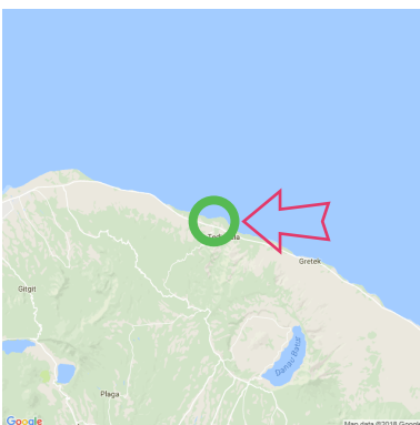
Bali au Naturel (21-05-2018)