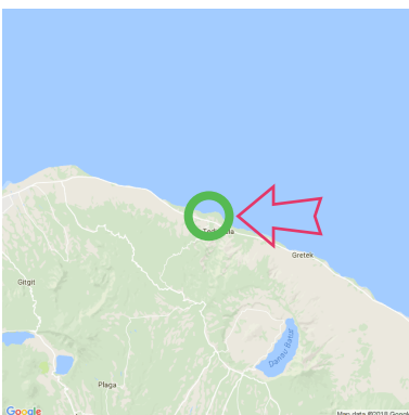
Bali au Naturel (18-01-2018)