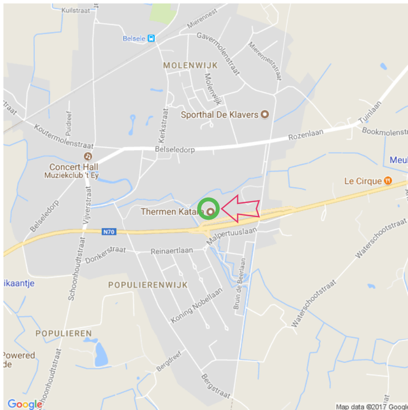
Thermen katara (18-09-2017)