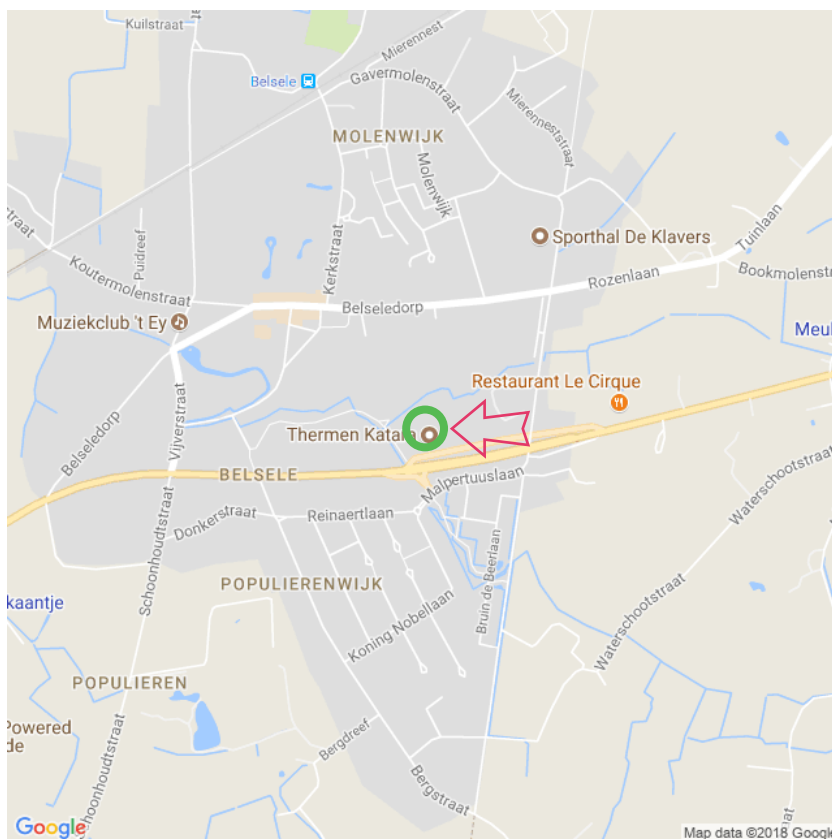
Thermen katara (20-03-2018)