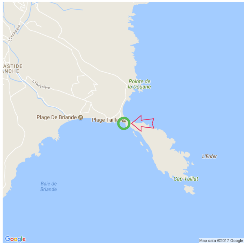
Plage du Cap Taillat (15-10-2017)