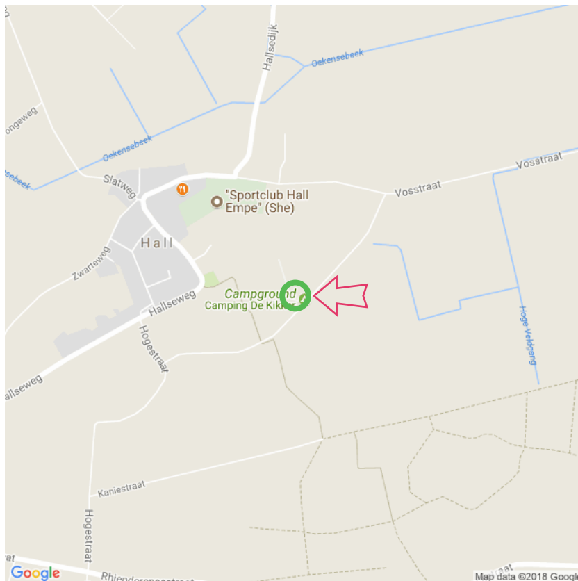
Minicamping De Kikker (22-03-2018)