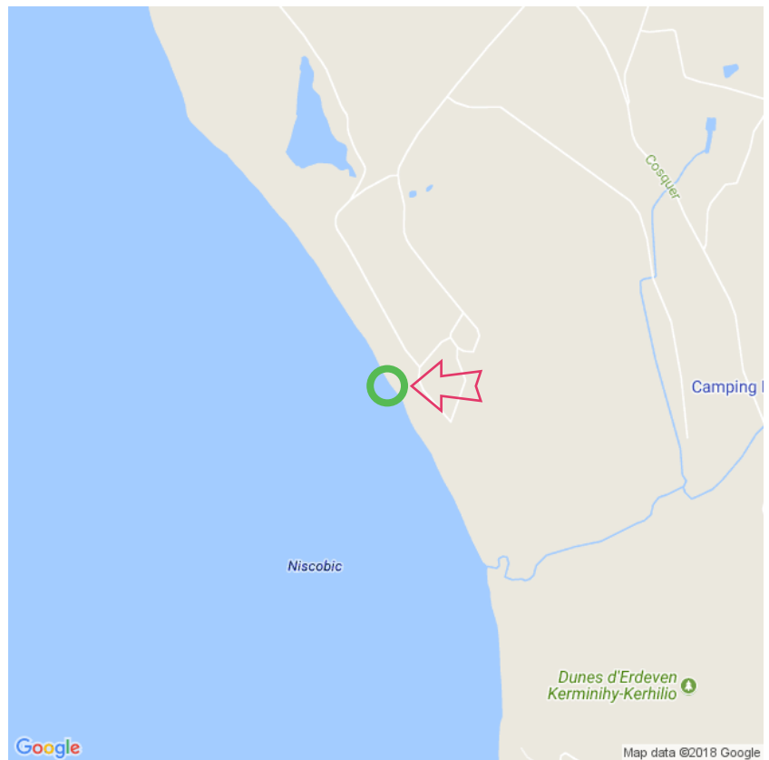
Plage de Kerminihy (16-01-2018)