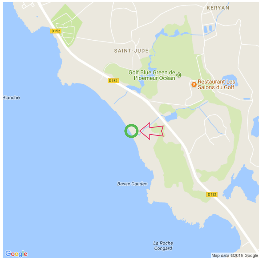
Plage des Kaolins (17-01-2018)