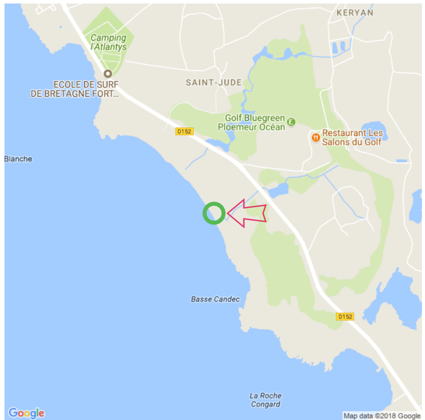
Plage des Kaolins (20-03-2018)