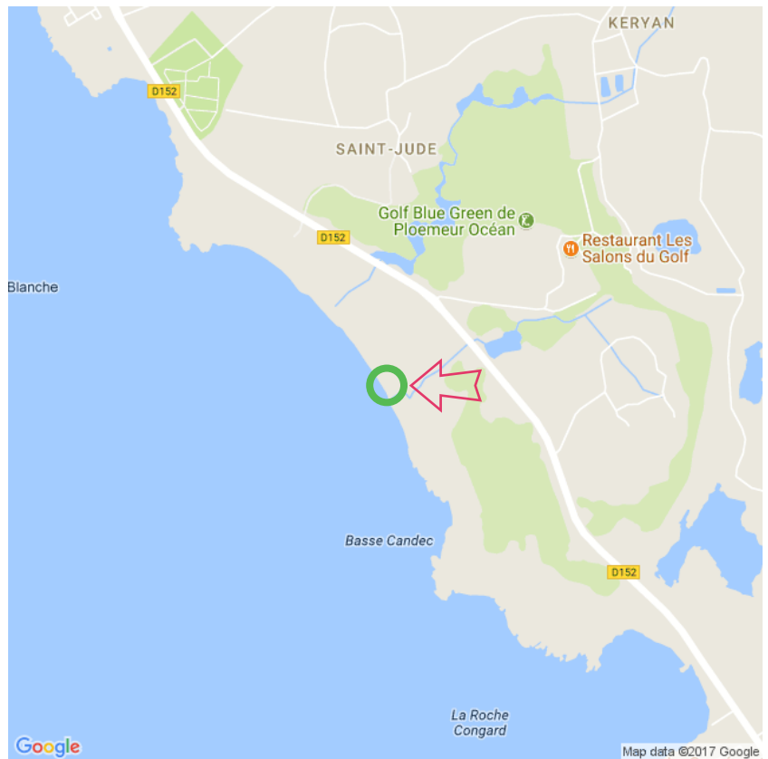
Plage des Kaolins (11-12-2017)