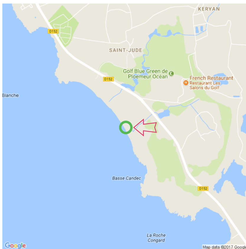
Plage des Kaolins (25-09-2017)