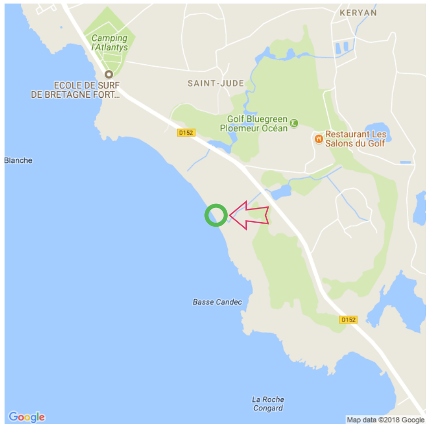
Plage des Kaolins (25-03-2018)