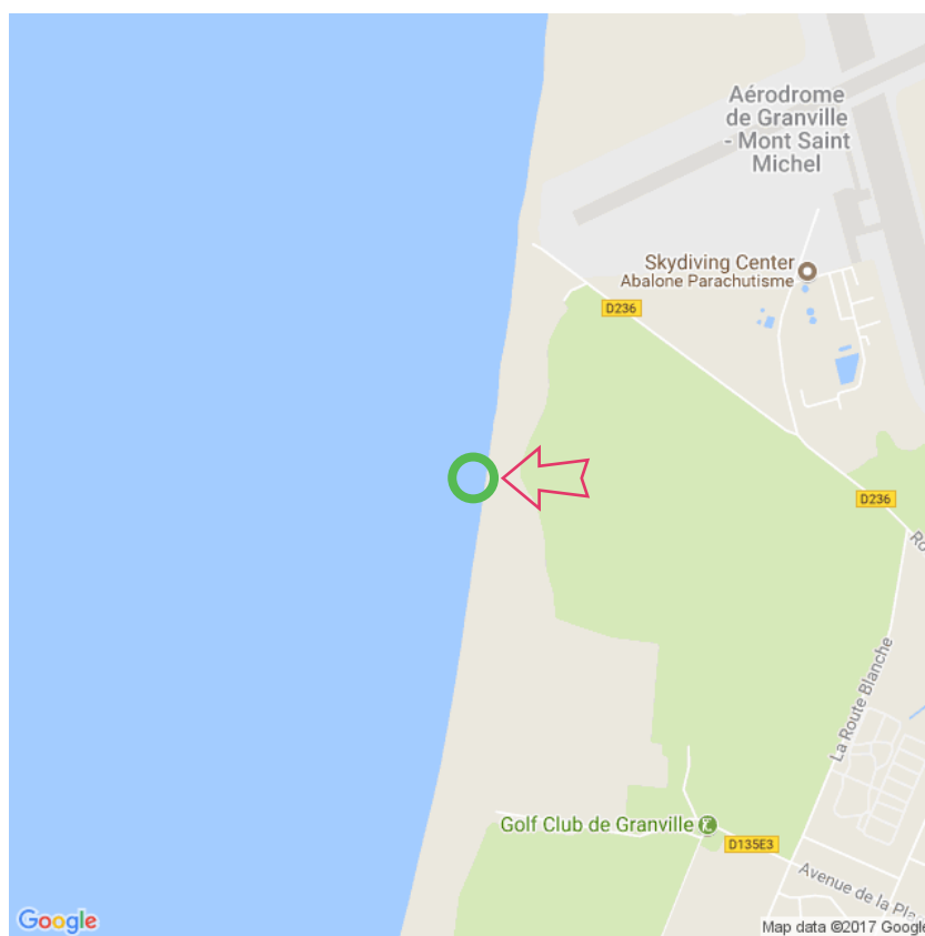
Plage de Bréville-sur-Mer (16-10-2017)