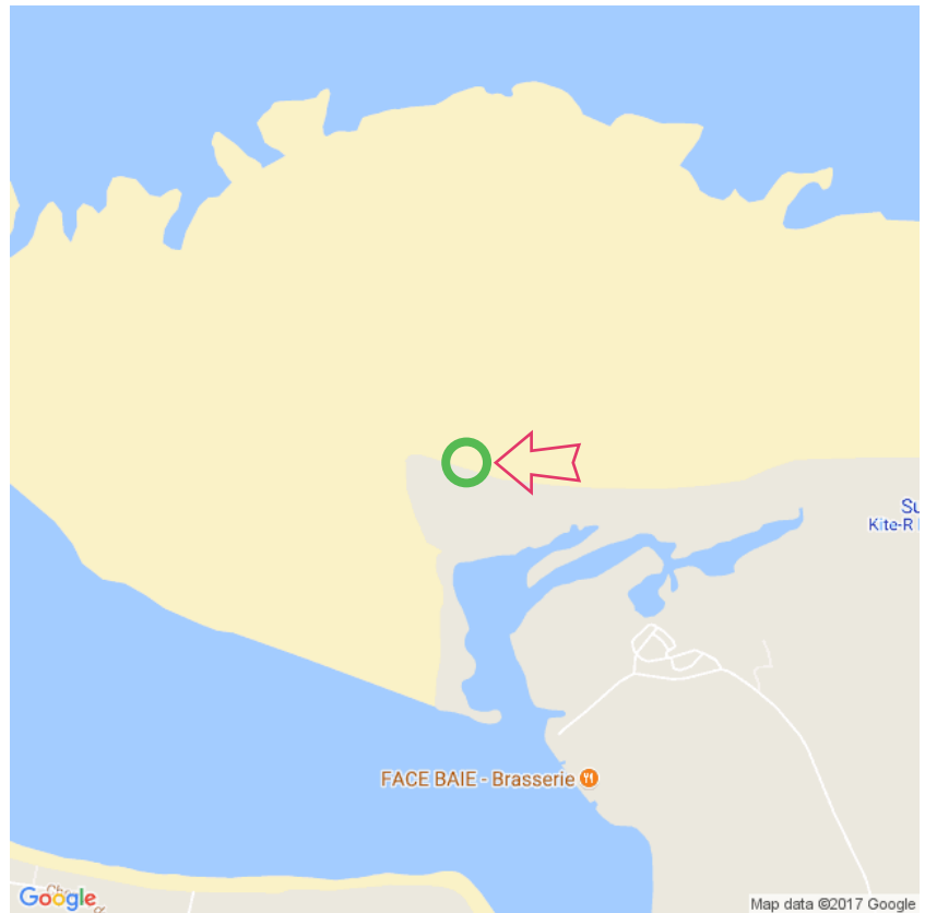
Plage de la Redoute (11-12-2017)