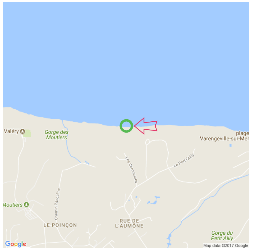
Plage de Varengenville-sur-Mer (15-12-2017)