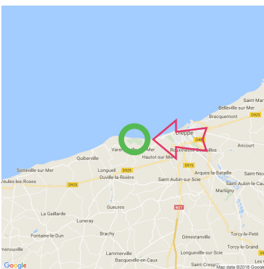
Plage de Varengueville-sur-Mer (20-06-2018)