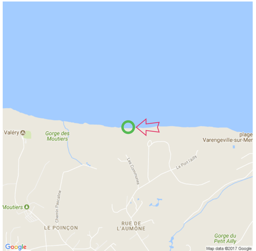
Plage de Varengeville-sur-Mer (25-09-2017)