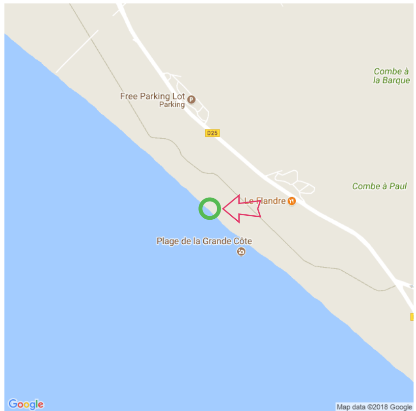
Plage de la Palmyre / Grande-Côte (17-03-2018)