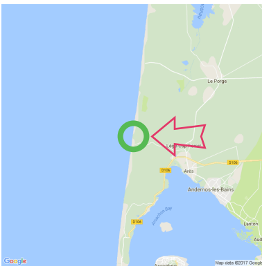
Plage du Grand Crohot (13-12-2017)