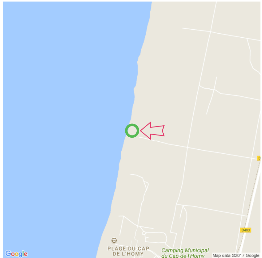
Plage du Cap de l'Homy (11-12-2017)