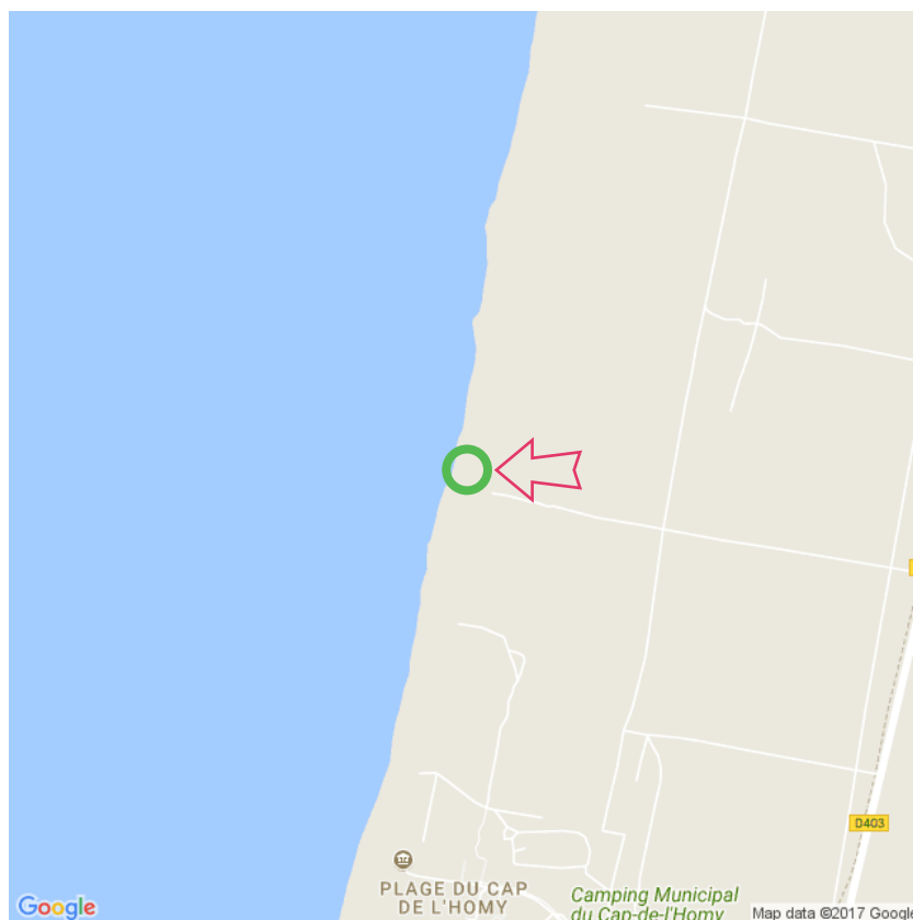
Plage du Cap de l'Homy (21-09-2017)