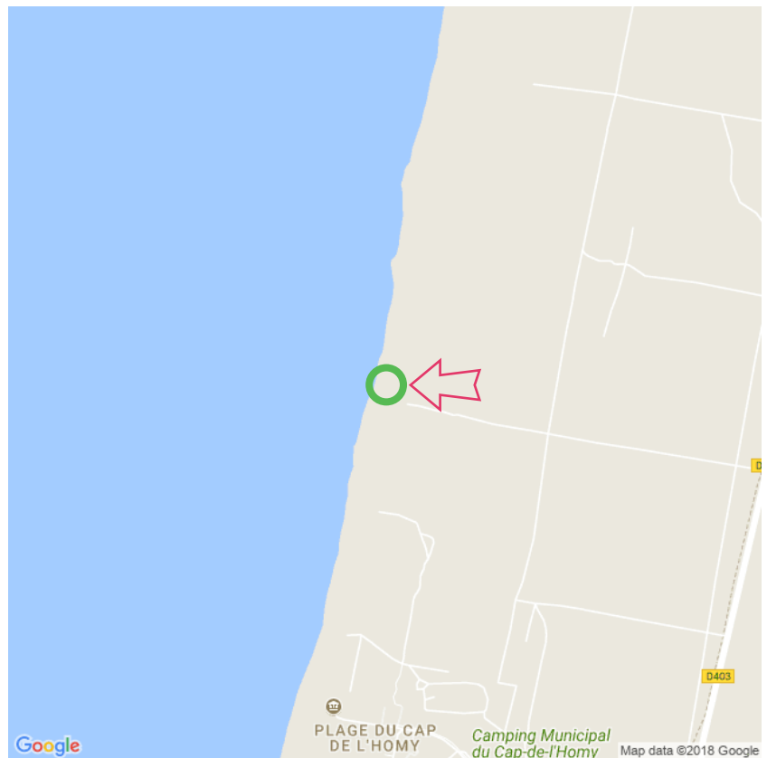
Plage du Cap de l'Homy (25-03-2018)