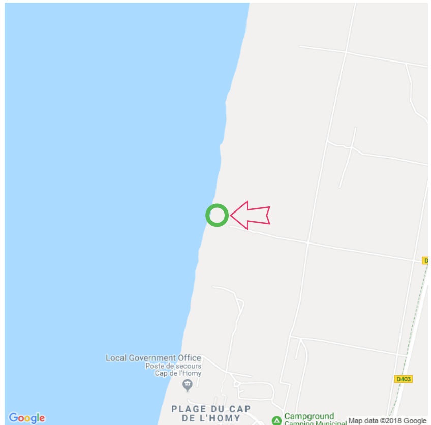
Plage du Cap de l'Homy (18-08-2018)