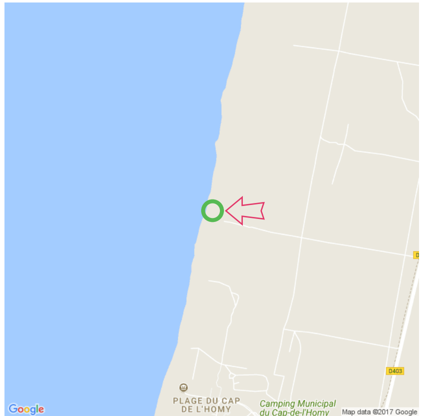
Plage du Cap de l'Homy (18-12-2017)