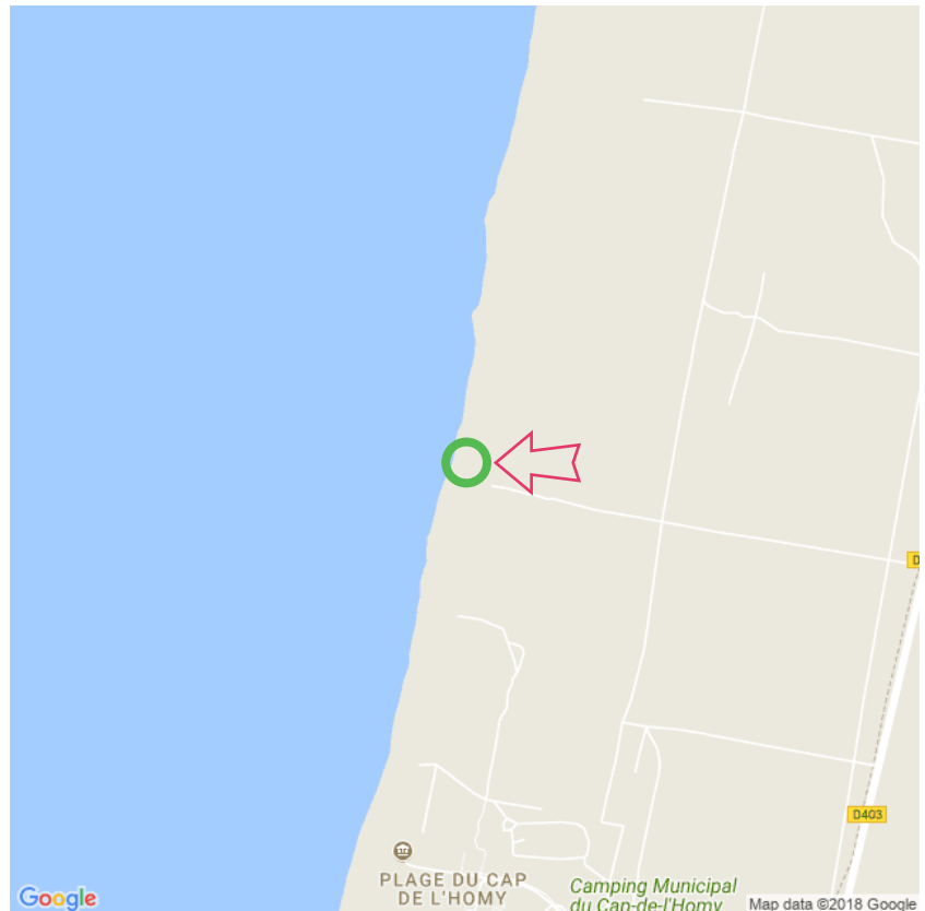
Plage du Cap de l'Homy (20-02-2018)