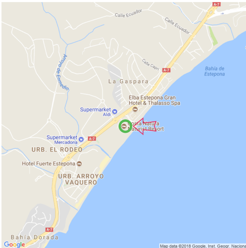
Costa Natura 167 (19-06-2018)