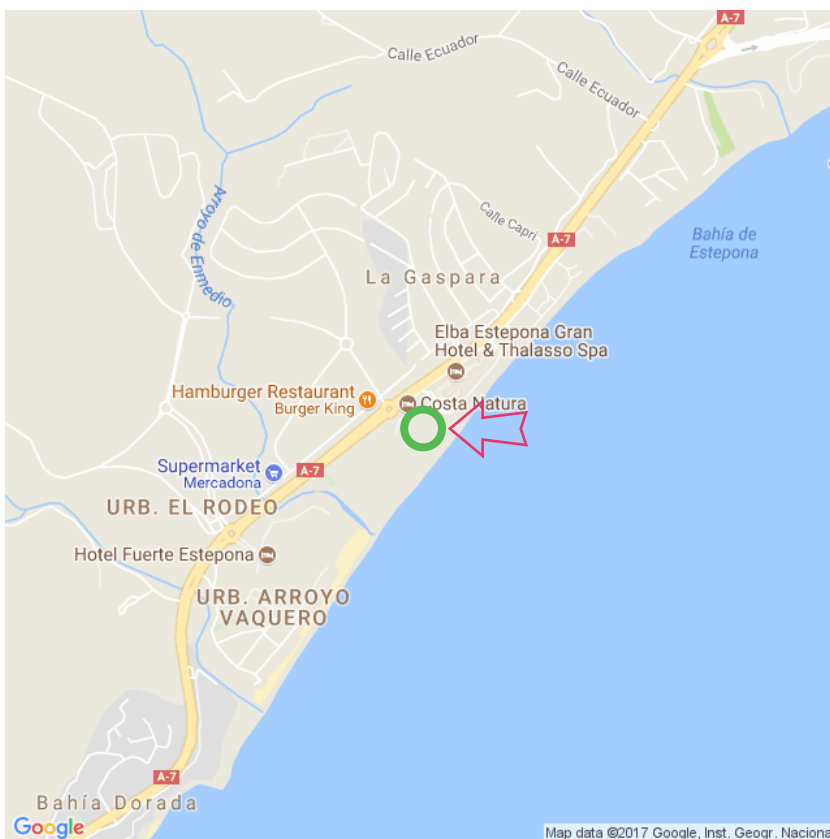
Costa Natura 167 (14-12-2017)