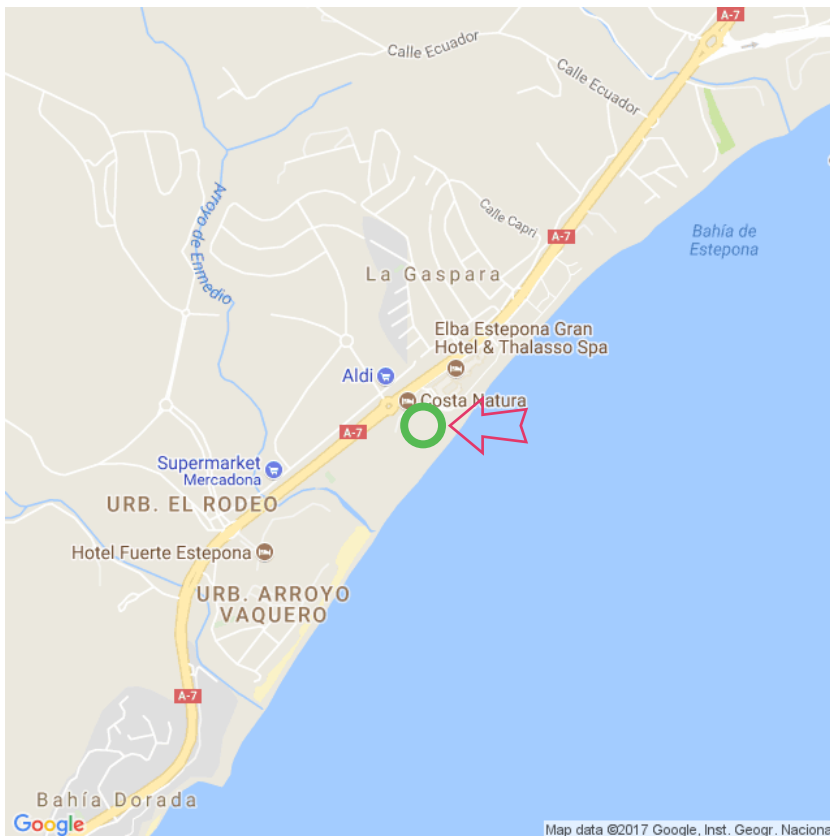
Costa Natura 167 (24-09-2017)