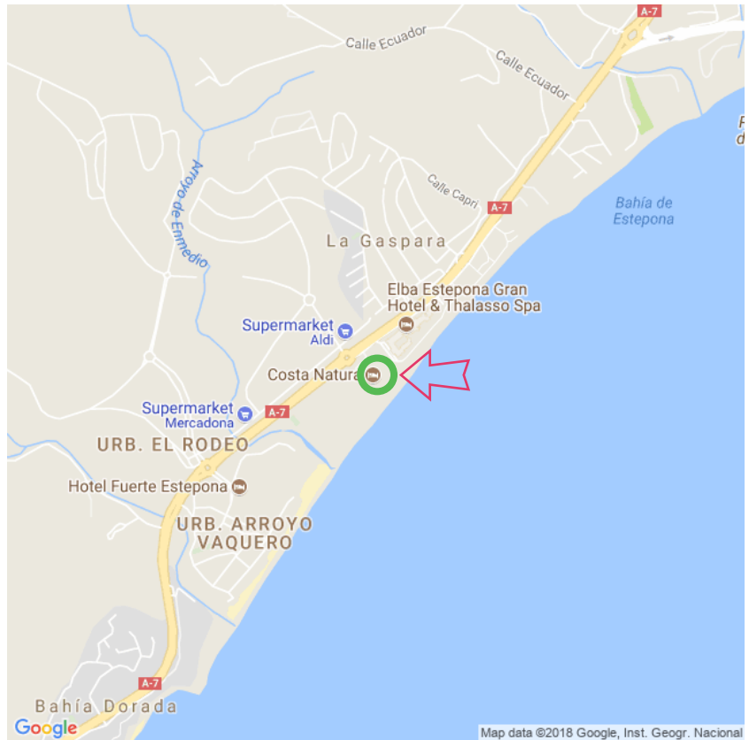
Costa Natura 167 (22-03-2018)