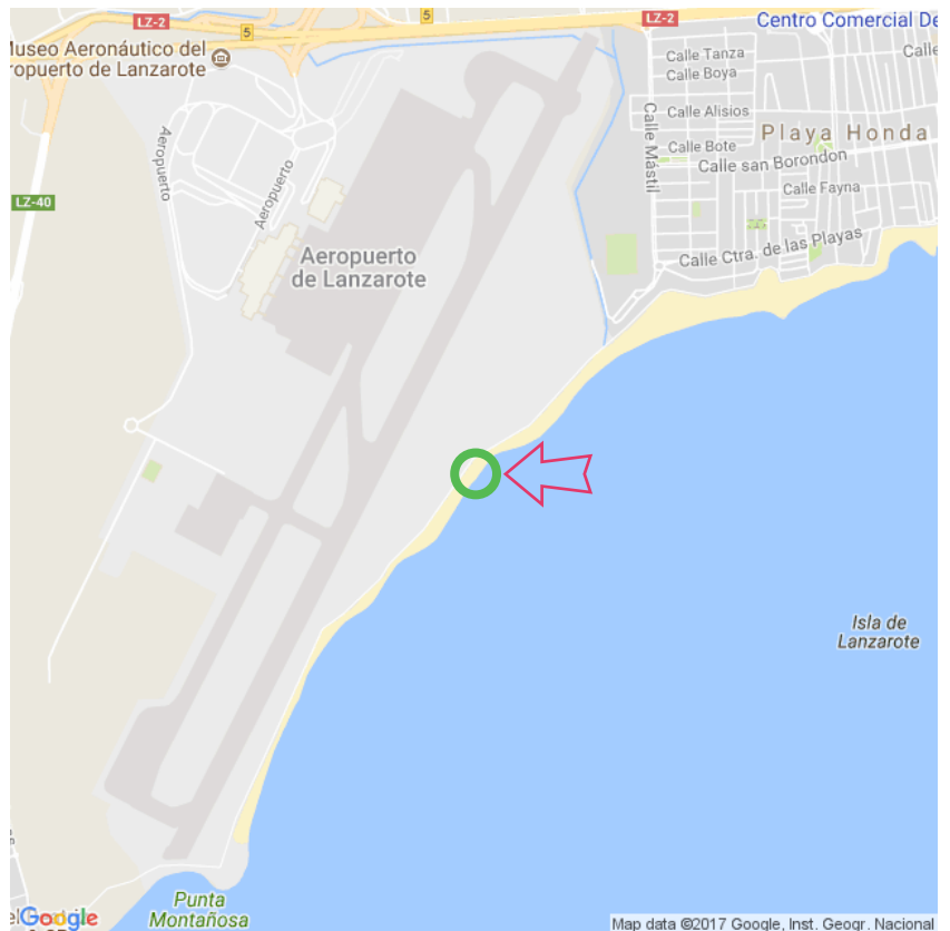
Playa Honda (16-01-2018)