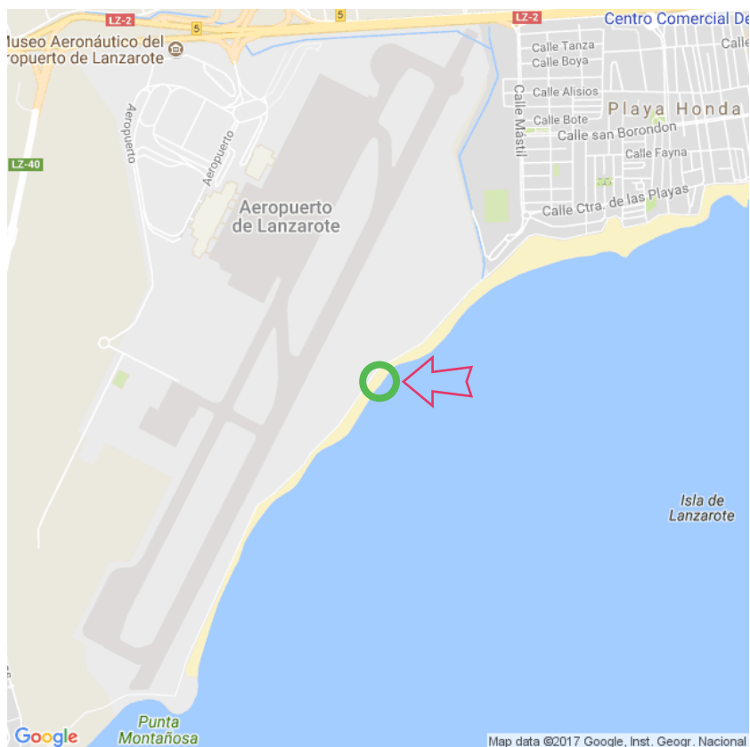
Playa Honda (10-10-2017)